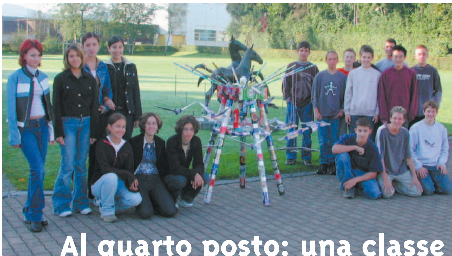
La classe 2b della Scuola media di Niederuzwil