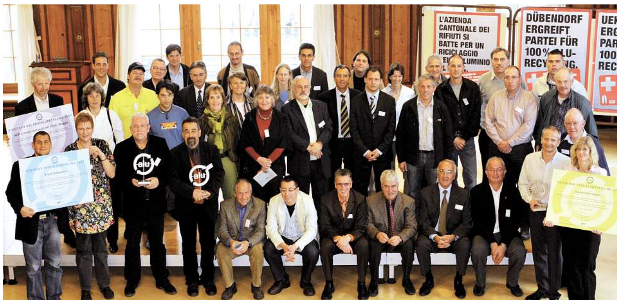
Numerosi rappresentanti di comuni e città erano presenti alla festa di premiazione nella sala municipale di Weinfelden.

Il compito dell'ACR consiste nell'informare i circa 320 000 abi-