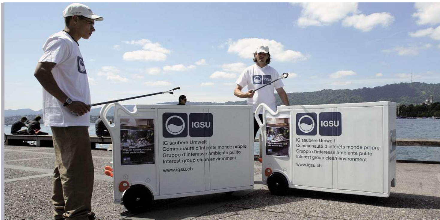
Ambasciatori «on the road» per una Svizzera pulita.

■ Sosteneteci nella lotta contro il littering. Mettiamo gratuitamente a disposizione manifesti e materiale informativo. Da ordinare all'indirizzo www.igsu.ch