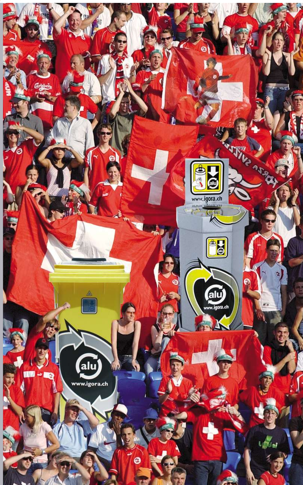
I contenitori per il recupero delle lattine in alluminio incitano i tifosi di calcio alla raccolta.

In giugno, alla festa del calcio, anche IGORA si troverà sulla linea di partenza. Infatti, se si festeggia viene sete e qui entrano in gioco le lattine d'alluminio. Esattamente secondo il motto EURO 08 «Vivi le emozioni», negli stadi, nelle aree riservate ai tifosi e nelle zone «Public-Viewing» verrà dato il via alle manifestazioni. Per far sì che nella miscita delle bevande tutto funzioni con la ben nota perfezione svizzera e austriaca, gli organizzatori hanno indicato la direzione da seguire con ampio anticipo.