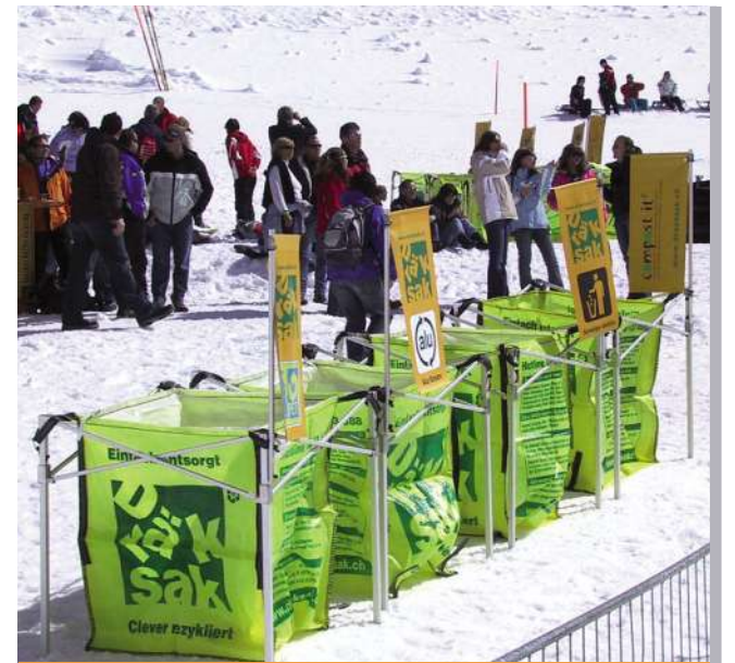
Novità: 400 sacchi speciali «Dräksak» per la raccolta dell'alluminio durante le manifestazioni.

■ Che belle prospettive per il «Dräksak» adibito alla raccolta di lattine d'alluminio!