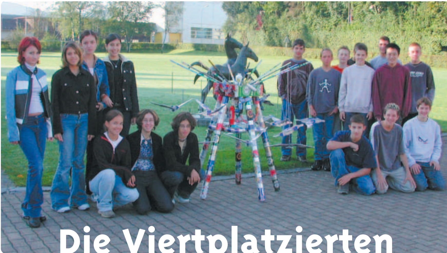
Die Schulklasse 2b der Sekundarschule Niederuzwil