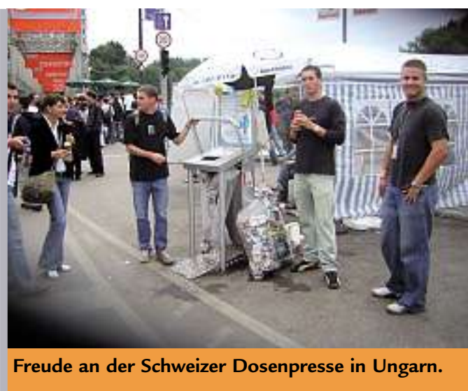
Freude an der Schweizer Dosenpresse in Ungarn.

■ Mehr Informationen: http://www.aluminiumtaldoboz.hu