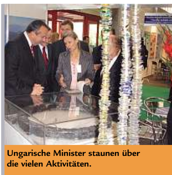
Ungarische Minister staunen über die vielen Aktivitäten.