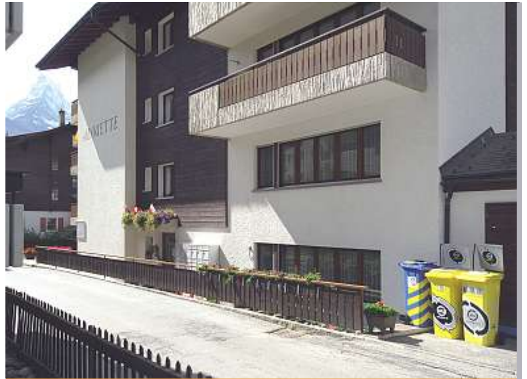
IGORA-Sammelbehälter beim Ferienhaus Alouette in Zermatt.