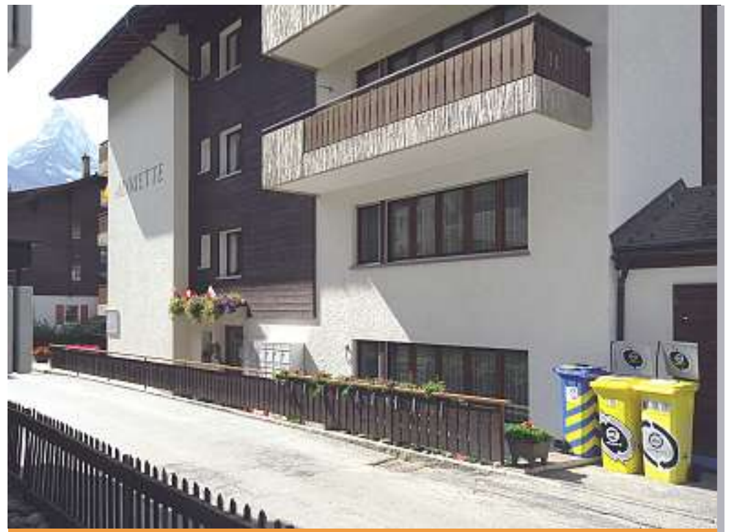
Conteneur IGORA de la résidence de vacances Alouette à Zermatt.

C'était avant la fin juillet. Entre-temps, il y a bien des touristes du monde entier qui y déposent quelques canettes. Mais, selon Sandro Biner, la saison d'été est plutôt calme à Zermatt. Le résultat de la collecte est donc un peu réduit. Les trois Valaisans se réjouissent d'autant plus du «full house» de leur 15 appartements pendant la saison d'hiver à venir et espèrent que les conteneurs seront approvisionnés par plein de canettes et d'emballages en alu. Les Biner donnent le bon exemple. S'ils réussissent comme ils l'espèrent – ce qui est prévisible grâce à la bonne coopération avec IGORA – il est certain que d'autres habitants de Zermatt suivront leur exemple.