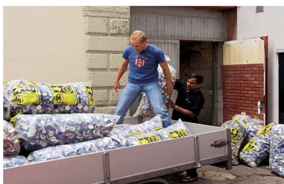
Résultat de collecte impressionnant au Club The Loft à Lucerne.

Dans le club pour initiés The Loft à Lucerne, le recyclage de l'aluminium est réalisé à 100 pour cent. Les garçons qui font le service débarrassent les tables et déposent les canettes en aluminium dans des conteneurs spéciaux derrière le bar avant de les écraser dans la réserve et de les mettre dans des sacs de collecte. Régulièrement, l'établissement dépose jusqu'à 25 sacs de collecte pleins dans le centre de recyclage le plus proche.