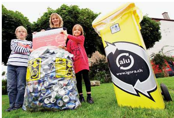
La famille Oetterli lors de la remise des prix 2010.