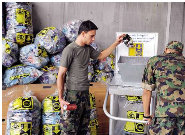
Des collecteurs d'aluminium enthousiastes parmi les recrues de la caserne de Neuchlen-Anschwilten.

Toute l'armée mise sur la collecte conséquente des matières premières. A la caserne de Neuchlen-Anschwilten, cela commence par la diffusion d'informations environnementales complètes dès le début de l'ER. On évite ainsi que la moindre canette en aluminium disparaisse dans les déchets tout au long du service militaire. Chaque ER remplit ainsi quelque 13 sacs de canettes en aluminium et les destine au recyclage.